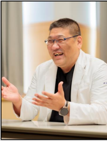
(写真:センター長 能勢先生)

近年本邦では、高齢者が増加し、種々の排尿障害に罹患し治療を受けている患者が増え続けています。代表的な前立腺肥大症は、その有病率は55歳以上に400万人ほど潜在的罹患者がいるといわれていますが現状で診療を受けられていない患者さんは80万人程度と報告されています。また、排尿障害の代表的な疾患及び病態として、過活動膀胱が挙げられますが、40歳以上の男女のおよそ15%（1800万人）が過活動膀胱に罹患していることが示されています。そこで、前立腺疾患や排尿に関する診断治療を担う泉州地区唯一のセンターを2024年4月に開設しました。その業務の一部を以下の通り紹介します。